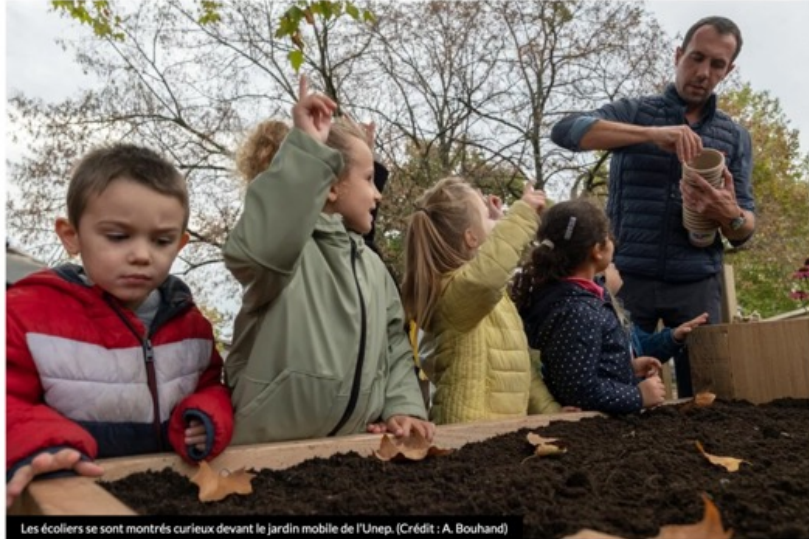
Les écoliers se sont montrés curieux devant le jardin mobile de l'Unep.

Urbanisme. L'Union des Entreprises du Paysage Bourgogne Franche-Comté part à la rencontre des élèves de la région, en commençant par Beaune pendant deux jours en ce mois d'octobre. Par l'intermédiaire d'un jardin mobile, la profession souhaite sensibiliser la jeune génération à la végétalisation des villes et aux métiers en lien avec les espaces verts.