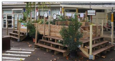
Ce jardin mobile est installé sur une charrette en bois de frêne local de six mètres de long et deux mètres de large.