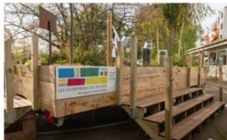
C'est à l'école des Blanchès-Fleurs de Beaune que le jardin mobile de l'Unep-BFC a fait sa première sortie.

gétation : gazon, fleurs, potager, plantes aromatiques, arbre, insectes, et même le brouillard ! Plusieurs modules sont organisés pour faire participer les enfants, dont un remorqueur de 2 m par 6 m, à hauteur d'enfant. Le jardin mobile peut accueillir jusqu'à 70 enfants par jour et est complété par un dispositif pédagogique dispensé par les enseignants. Il présente plus de 50 végétaux, 9 arbres, 30 arbustes, du gazon naturel.