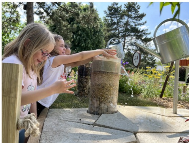
À l'école des Aiguisons de Quétigny, le jardin mobile a fait l'unanimité chez les écoliers.

Vendredi 26 mai, un jardin mobile a pris place dans la cour de l'école des Aiguisons, à Quétigny. Une initiative de l'Union des entreprises du paysage de Bourgogne-Franche-Comté (Unep BFC) pour sensibiliser les écoliers et parler des vertus de leur métier.