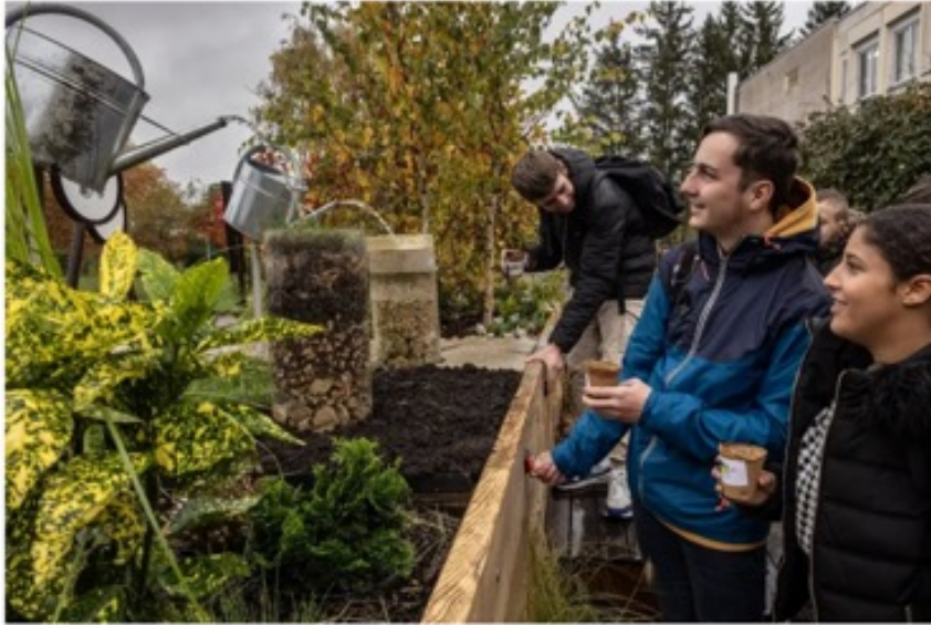
Un jardin ambulant, ou quand la nature vient aux écoliers de Bourgogne