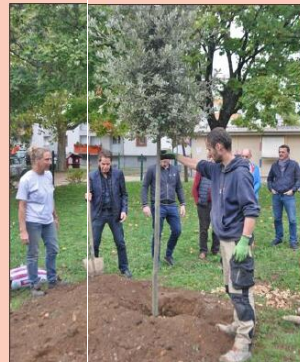
Pour symboliser la présence de ce jardin mobile, un arbre a été planté dans la cour de l'école des Blanchés-Fleurs.

Ce procédé sera réitéré lors de chaque passage du jardin mobile dans les écoles.