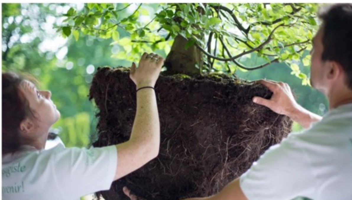
Le jardin mobile de l'Unep de Bourgogne-Franche-Comté s'installe ce 20 octobre dans la cour de l'école des Blanches-Fleurs, à Beaune, en Côte-d'Or.