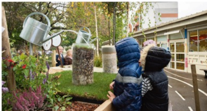
Avec cet outil pédagogique, l'Unep BFC veut sensibiliser les enfants à l'importance des espaces verts mais aussi créer des vocations pour un secteur dont 67 % des entreprises avouent avoir du mal à recruter.

Le 20 octobre à Beaune était lancé le jardin mobile de l'Union des entreprises du paysage de Bourgogne Franche-Comté. L'occasion de sensibiliser les plus jeunes à l'importance des espaces verts, mais aussi de susciter des vocations pour un secteur qui peine à recruter.