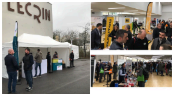
Salon pro 2022, Talant