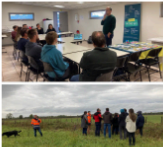
Matinée technique génie écologique, Flammerans 2023